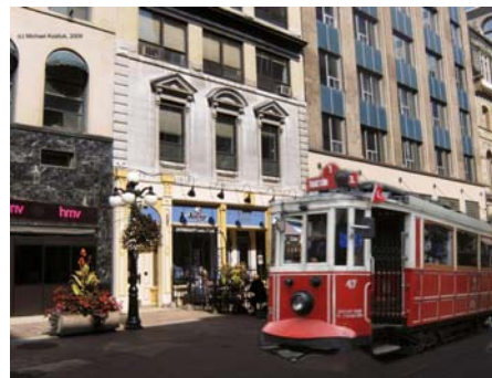
Représentation simulée du tramway sur la rue Sparks

Opérer en aller-retour un tramway de petite taille et de style historique sur une voie unique le long de la rue Sparks entre le nouveau Centre des congrès et le Musée de la guerre à Lebreton Flats.